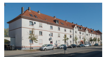
Immobilien-Portfolio Fulda (Fondsgesellschaft ICD 8 R+)