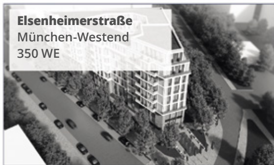
Elsenheimerstraße München-Westend 350 WE