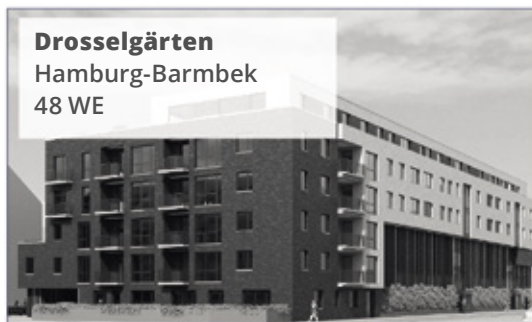
Drosselgärten Hamburg-Barmbek 48 WE