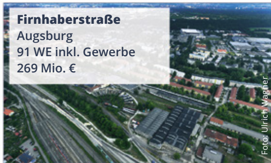
Firnhaberstraße Augsburg 91 WE inkl. Gewerbe 269 Mio. €