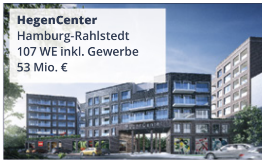
HegenCenter Hamburg-Rahlstedt 107 WE inkl. Gewerbe 53 Mio. €