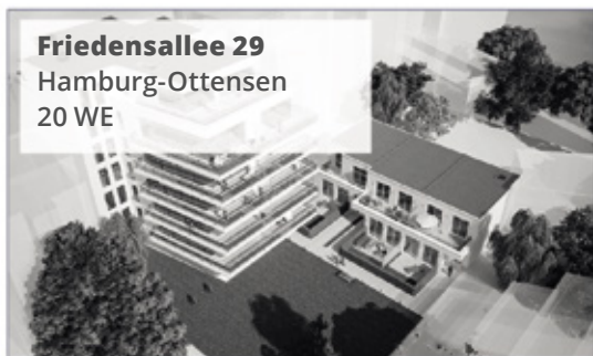
Friedensallee 29 Hamburg-Ottensen 20 WE