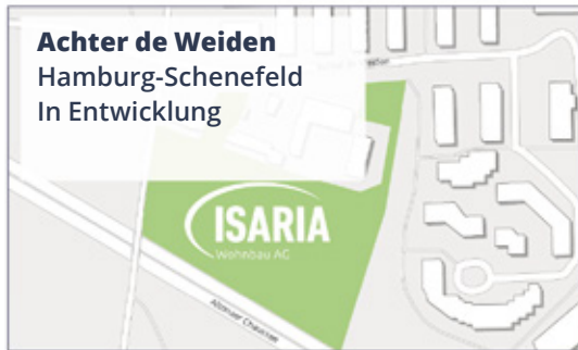
Achter de Weiden Hamburg-Schenefeld In Entwicklung